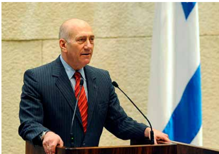
אהוד אולמרט.

אף ששני המקרים אירעו בעת המודרנית, אנו טוענים כי בהופעותיהם התקשורתיות של המנהיגים אפשר למצוא רכיבים רטוריים קלאסיים ששורשיהם בימי התמסדות הדמוקרטית ביוון העתיקה: אתוס, לוגוס ופתוס. אחת המטרות של ההופעות התקשורתיות בנסיבות אלה הייתה להשפיע על דעת הקהל ולנסות להטותה לטובתם. השערותנו הייתה שהטקסטים הללו יכללו נרטיבים כמו: "הנאשם כנרדף", "אכיפה בדרנית" ו"תרומתו הציבורית של הנאשם גוברת על ההאשמות". ניתוח הנאומים מאשר השערה זו. בשני המקרים תקפו האישים את התקשורת, אך בה בעת השתמשו בה להטות (או לנסות להטות) את סדר היום התקשורתי לטובתם בניסיון לחזק את חפותם בשיח הציבורי. עם זאת יש הבדלים בין הנאומים. בעוד אהוד אולמרט שמר על ממלכתיות ואמון במערכות המשפט והצדק, הדגיש נתניהו טענות על שחיתות וריקבון מערכות שלטון החוק ורדיפה על בסיס אישי ופוליטי. כמו כן מצאנו כי נתניהו נתן בנאומו דגש רחב על רכיבי הפתוס הרטוריים, וכי מטרה מרכזית בנאומו הייתה לעורר רגשי כעס בקרב המאזינים ולהניע אותם למחאה ולהתנגדות. מדובר במחקר שיטתי של נושא המצוי בשיח חברתי שבו מעורבים לא אחת שיח יצרי, רגשי ורווי בדעות קדומות. מחקר זה מציע התבוננות אחרת באמצעות כלים אמפיריים. מצאנו שאפשר להשתמש במאפיינים הרטוריים הקלאסיים באופן שמאפשר את הגדרתם של ראשי המדינה הנאשמים בפלילים כגיבורים טרגיים מודרניים.