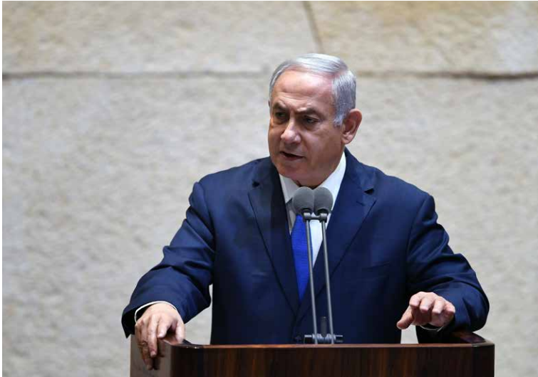
בנימין נתניהו.